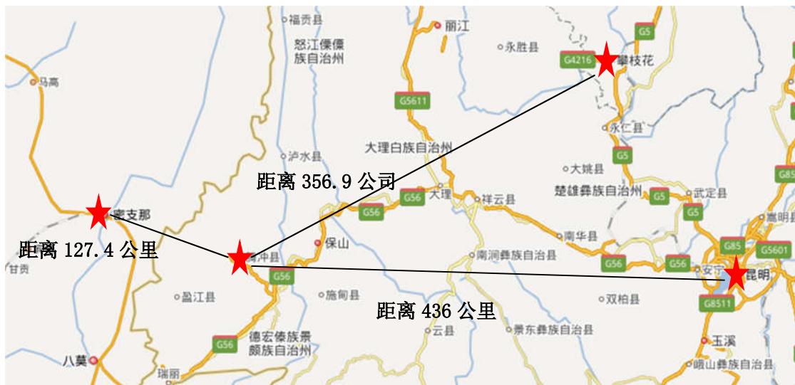
腾冲市交通区位图

腾冲市位于云南南部，与缅甸山水相连，国境线长 148.075 公里。距省会昆明 436 公里，距缅甸密支那 127.4 公里，境内有国家一类口岸——猴桥口岸和自治、滇滩、胆扎等 16 条通道，是中国陆路通向南亚、东南亚的重要门户，是中缅贸易的重要前沿。腾冲交通条件便捷，有腾冲——密支那、腾冲——板瓦两条二级国际公路通往缅甸克钦邦；由昆明出发经腾冲至缅甸密支那到印度雷多的中缅印国际大通道（即著名的史迪威公路）昆明—腾冲—密支那段已全部实现高等级化，密支那——缅印边境班哨段晴通雨阻，这条大通道是连接中、缅、印三国中里程最短、条件最优、最为便捷、辐射人口最多的一条陆路大通道。腾冲机场 2009 年 1 月建成通航，累计开通 16 条航线，2016 年旅客吞吐量达 80.56 万人次，航班量 7144 架次，现已启动二期改扩建及航空口岸建设。保山至腾冲（猴桥）铁路已列入《国家中长期铁路网规划》和云南省“五出境”铁路网发展规划，现正在争取列入国家“十三五”规划。立体式的交通网络，使腾冲在中国面向南亚开放中的区位优势更加突出，为腾冲赢得了巨大的发展机遇。